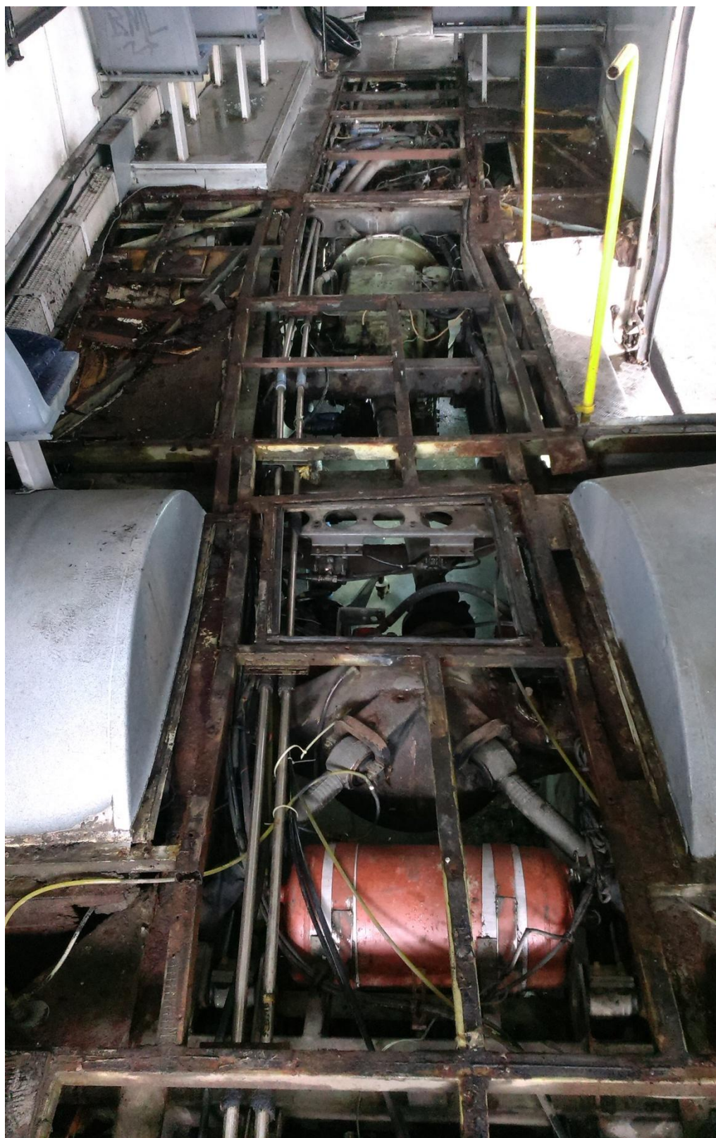
Сл. 1. Приказ деформације на шасијским елементима као последица бочног удара